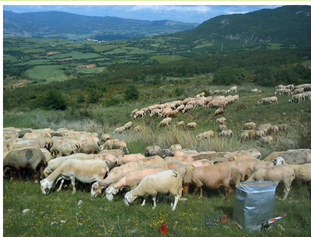
Foto 1. El tipus i càrregues de bestiar, i la distribució dels prats dins del paisatge, afecten els serveis ecosistèmics i els embornals de carboni.

L'objectiu principal d'aquest projecte demostratiu és l'elaboració d'un manual de bones pràctiques per augmentar el carboni al sòl dels sistemes pasturats.